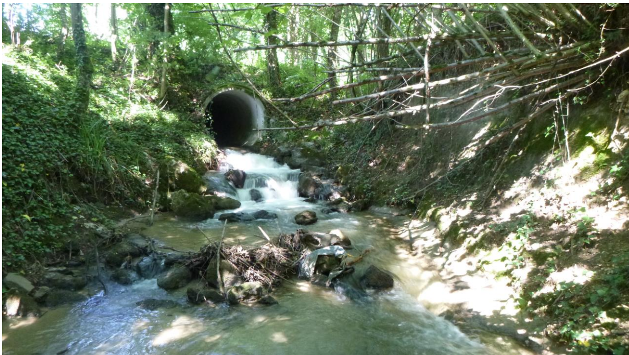
Vue de la buse existante prise en aval

La buse étant lisse et de grande longueur, des barrettes en béton seront mises en place en quinconce tous les 1,50 m de manière à créer des zones de repos.